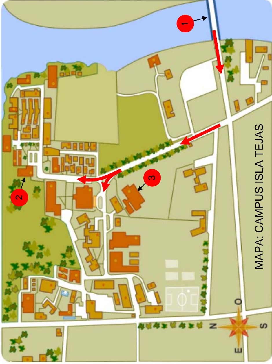
MAPA: CAMPUS ISLA TEJAS